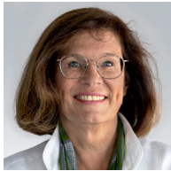
Antje Tillmann MdB Finanzpolitische Sprecherin der CDU/CSU-Bundestags- fraktion