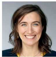
Katharina Beck MdB Finanzpolitische Sprecherin der Bundestagsfraktion Bündnis 90/Die Grünen