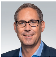
Michael Schrodi MdB Finanzpolitischer Sprecher der SPD- Bundestagsfraktion