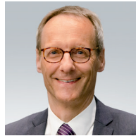
Meinhard Wittwer Vizepräsident des Bun- desfinanzhofs