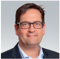
Markus Herbrand MdB Finanzpolitischer Sprecher der FDP- Bundestagsfraktion